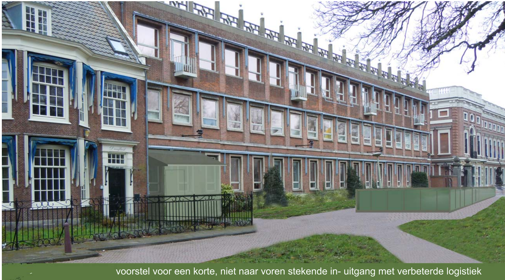
voorstel voor een korte, niet naar voren stekende in- uitgang met verbeterde logistiek