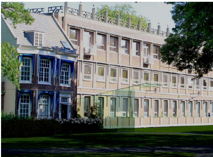
Impressie van architectenbureau C&K