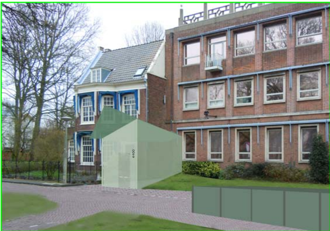
Voetgangers in- uitgang (2)