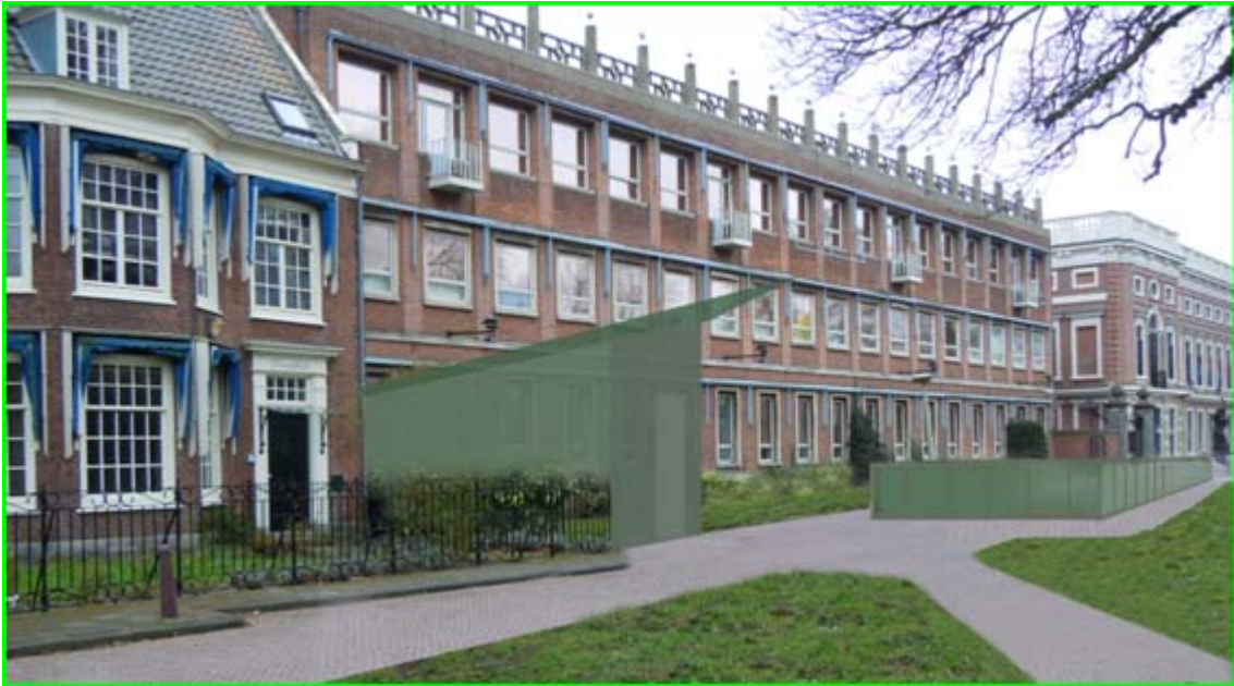
Voetgangers in- uitgang (1) en hellingbaan