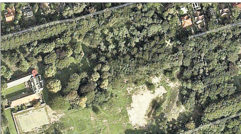
Google satellietfoto van Groot Bentveld (A). Het fundament voor de controversiële poort ligt bij het kruisje (X) aan het einde van de Taxuslaan. (Bewerking: Ruud Vader). ●

Voor verdere info zie www.muzenhuis.nl of bel 023 - 536 05 25