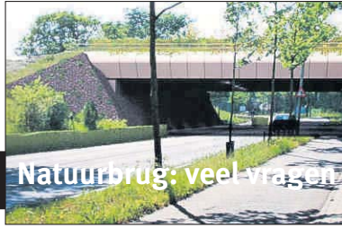
Natuurbrug: veel vragen