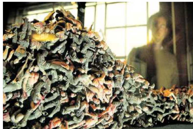
Hell (2000), Jake en Dinos Chapman.