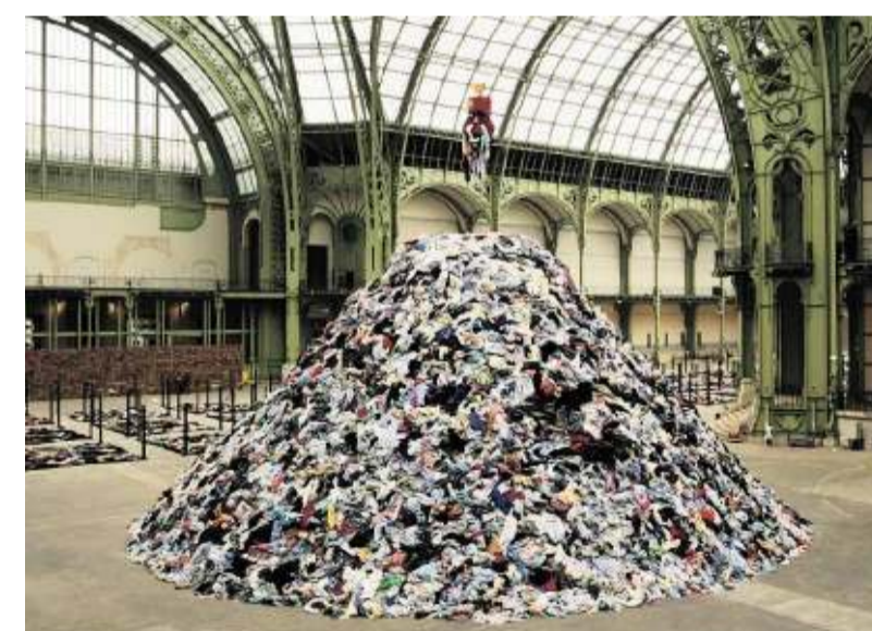
Personnes (2010), Christian Boltanski.