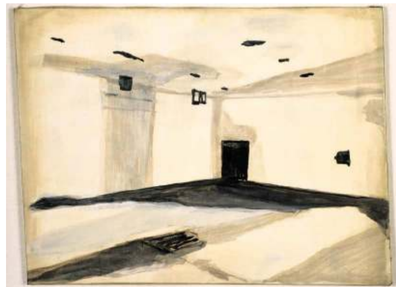
Gaskamer (1986), Luc Tuymans.