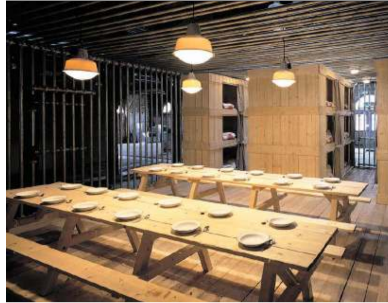
Disciplinator (2002), Atelier Van Lieshout.

ANALYSE HEDENDAAGSE KUNST MET NAZI-SYMBOLIEK