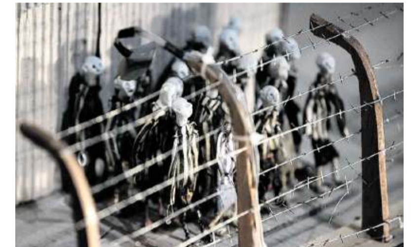
Kamp (2005) van Hotel Modern.