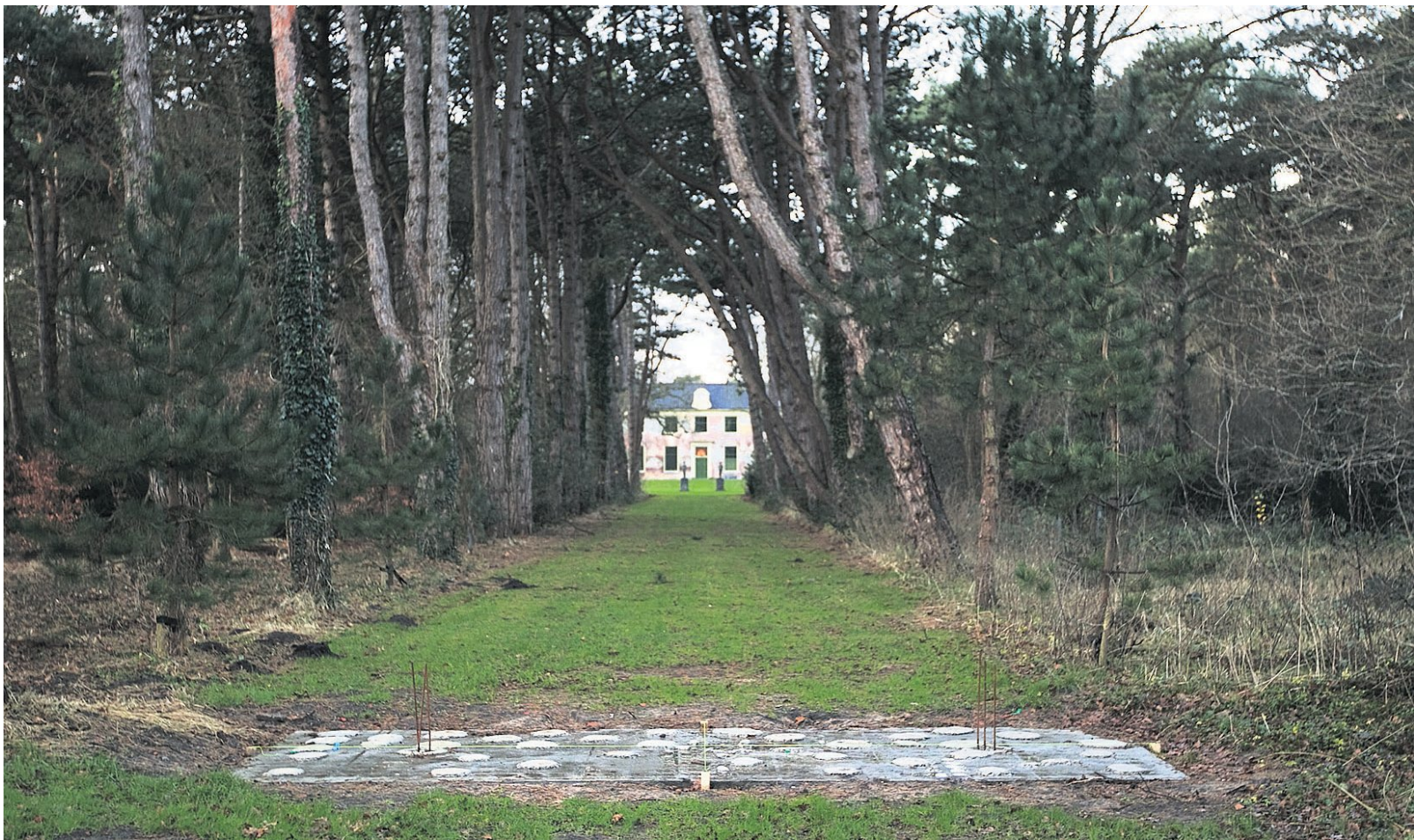
Uitzicht op landgoed Groot Bentveld waar het hek van Studio Job moeten komen.